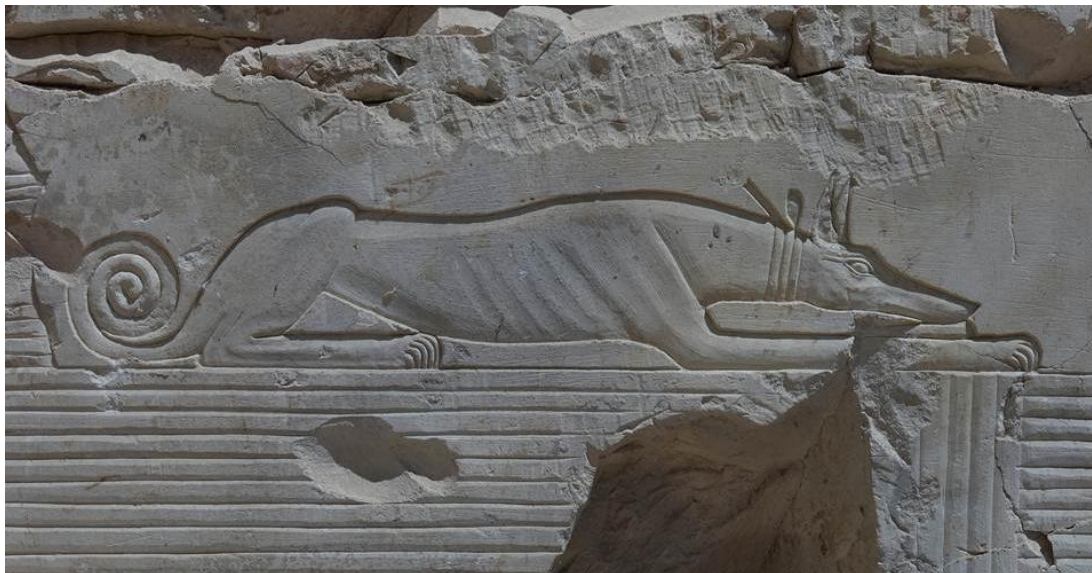
De hond onder de stoel van Karakhamon (TT 223)

Tijdens het verblijf van Mehen in Luxor van 28 september t/m 12 oktober 2012 hebben de deelnemers aan deze reis van 1 t/m 4 oktober de conferentie "Thebes in the First Millennium BC" in het Mummificatiemuseum te Luxor bijgewoond. Deze conferentie werd georganiseerd door "The South Asasif Conservation Project" (SACP) in samenwerking met het Ministerie van Oudheden en het gouvernement van Luxor.