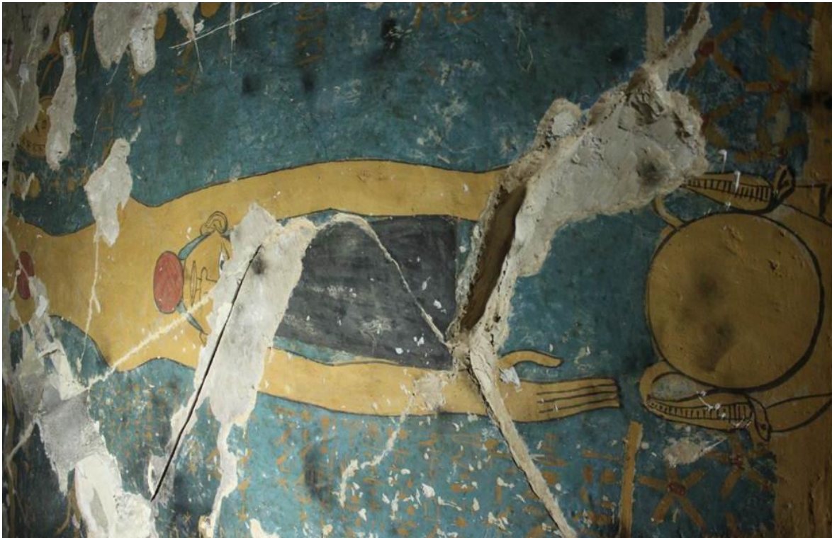
Foto van het plafond met Noet in de grafkamer van Karakhamon