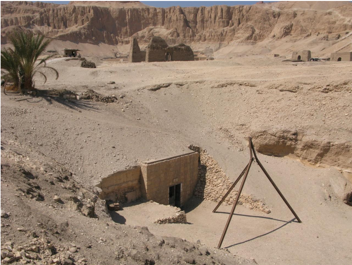
De ingang van het graf van Padiamonope met op de achtergrond de bovenbouw van het graf van Montjoe-emhat en de tempel van Deir el Bahri

Al met al was het een zeer informatieve en geslaagde conferentie waar iedereen tevreden op kan terug kijken en waar Mehen zeker nog op zal terugkomen. Een verslag van de volledige reis zult u in het komende Mehen Nieuws aantreffen.