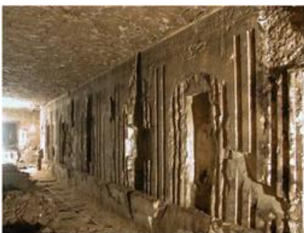
Cenotaaf voor Osiris in TT 33