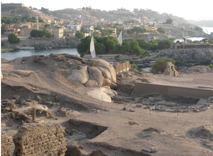
Overzicht over Elefantine

Dinsdag arriveren we met een vroege vlucht we in Aswan, waar de temperatuur al snel boven de 30° C stijgt. Ons hotel ligt aan de Nijl en 's middags varen we met een feloeka naar Elefantine, waar we de tempeltjes van Satet uit het Oude Rijk tot de Late tijd bekijken en genieten van de Chnoemtempel en de prachtige omgeving.