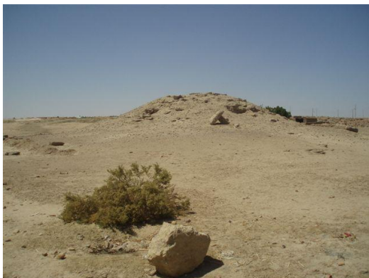
De piramide van Edfoe

De piramide van Edfoe zuid heeft een basislengte van 35-36 el, de hoogte is nog 5,5 m; vermoedelijk had ook deze piramide oorspronkelijk drie treden.