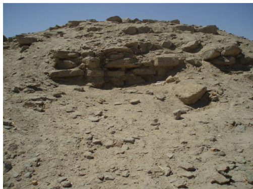
De piramide van Edfoe