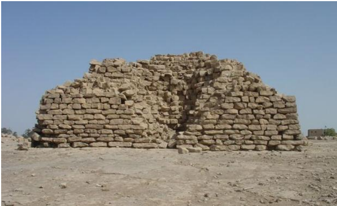
De piramide van Koela

De piramiden zijn waarschijnlijk onder farao Hoeni gebouwd, m.u.v. Seila die onder Snofroe is gebouwd. Het doel van deze piramiden is nog niet duidelijk, het zijn echter geen (konings)graven, als mogelijke betekenis is geopperd: