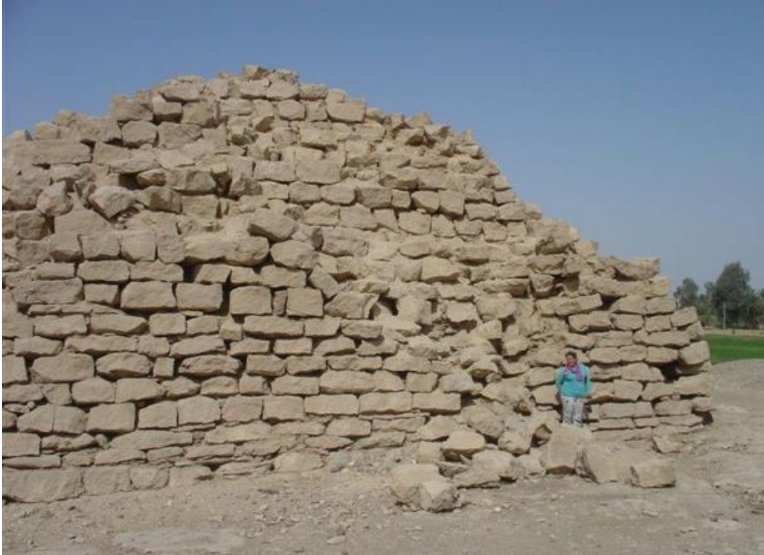
De piramide van Koela

De piramide van Koela heeft een vierkant grondoppervlak van 18,60 m 2 en is nog 8,25 m hoog, er zijn nog twee treden en gedeeltelijk is er nog een derde trede te zien.