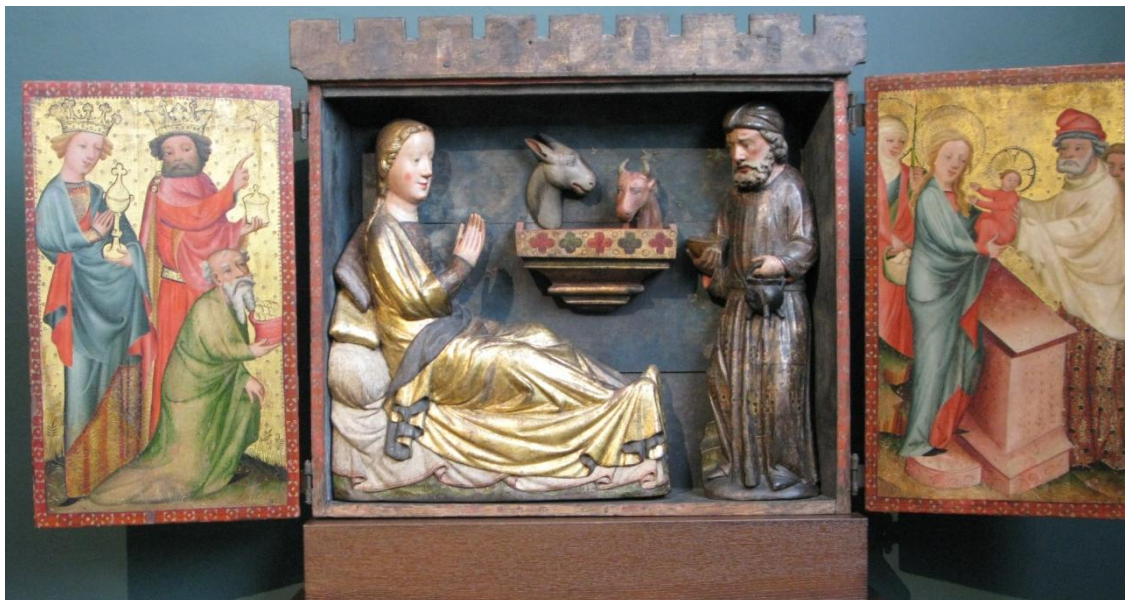
Hamburg, Kunsthalle, o.a. aanbidding van de drie koningen, ca. 1424

Bijna de hele week hadden we geluk met het weer en na afloop hebben we dan ook heerlijk buiten op een terrasje in Hamburg gegeten voordat wij de terugreis aanvaardden.