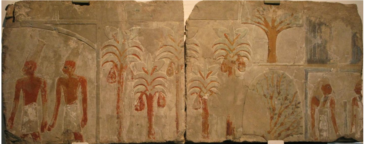
Reliëf uit het Kestner Museum, Hannover, te zien op de tentoonstelling in Keulen