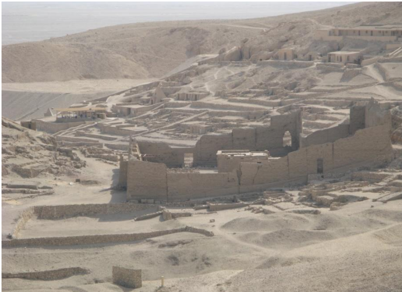
Deir el Medina vanuit het noord-oosten met op de voorgrond de tempel