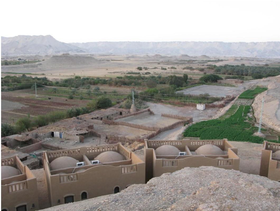
Dachla-oase vanaf de berg waaromheen de kamers van hotel Badawiya zijn gebouwd

De belangstelling voor deze reis is enorm, de reis is nu al volgeboekt; enkele mensen staan al op de wachtlijst. Indien u toch nog belangstelling hebt laat u dat dan weten, mogelijk kan Mehen een grotere bus regelen zodat iedereen die mee wil ook mee kan gaan.