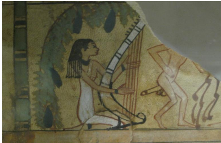
Harspeelster, MMA te New York

De volgende lezing zal plaatsvinden op zondag 6 november ook in het RMO te Leiden, aanvang 14.00 uur