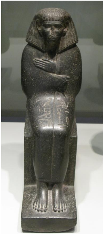
Beeldje Middenrijk, man in nauwsluitend gewaad. Museo Baracco te Rome

Kleren maken de man en de vrouw. Tijdens deze lezing vertelt Diana de Wild hoe kleding in het oude Egypte gemaakt werd en hoe kleding eruit zag. In het oude Egypte zijn vele bronnen beschikbaar: teksten, afbeeldingen en veel origineel textiel. In hun graven tonen de rijke Egyptenaren hoe vlas werd verwerkt tot linnen. Beelden laten ons zien hoe de kleding gedragen werd en archeologen vinden (delen van) garderobes terug. Hoewel de kleding in het oude Egypte niet zo aan mode onderhevig was als in onze tijd, zijn er zeker verschillen te zien in de loop van de tijd.