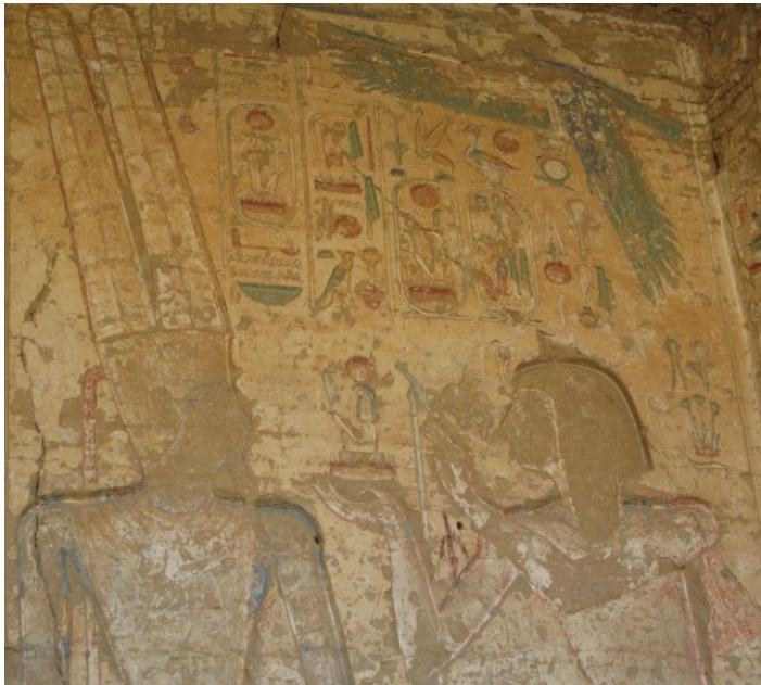
Seti I voor Amon-Ra

Zaterdag 27 november kwamen de deelnemers van de reis naar Egypte vermoeid, maar voldaan weer in Nederland terug. Onderdeel van de (studie)reis was een cruise met de luxe boot "Kasr Ibrim", uitgevoerd in art deco stijl, waarmee we de Nubische tempels hebben bezocht. Bevoorrecht was onze groep om als eerste sinds 35 jaar de (rots)tempel van Seti I te Kanais uitgebreid te mogen bekijken en te fotograferen, hierbij een foto uit deze tempel.