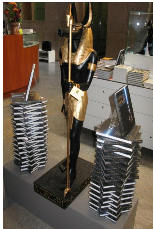
Anoebis bewaakt de catalogi

Ook ons dagelijks leven is doorspekt met kleine rituelen zonder dat we er stil bij staan, zoals “iets afkloppen” of iets in een bepaalde volgorde doen. Zoals Rafaël Nadal bij het tennissen ook eerst zijn water drinkt en dan pas een hapje banaan neemt. Ook bijgelovigheid is ons niet vreemd. Herkent u al wat dingen bij uzelf?