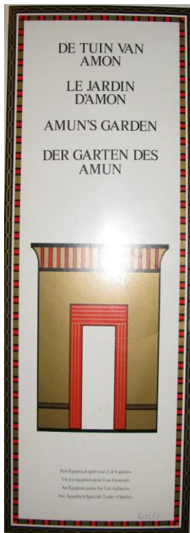
Het spel "De Tuin van Amon"

Donateurs kunnen een bod doen op dit spel, het hoogste bod krijgt uiteraard dit leuke spel. Het minimumbod is € 7,50 en er kan tot 1 januari geboden worden. De spelregels, gebaseerd op het senetspel en het palmspel, krijgt men er uiteraard bij.