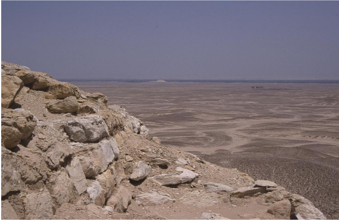
Op de voorgrond de piramide van Seila met uitzicht op de piramide van Meidoem (foto Jan Koek)

Egypte door de ogen van een 11-jarige Verslag Egyptereis oktober 2011 door Anne Hendriks foto's Paul Hendriks