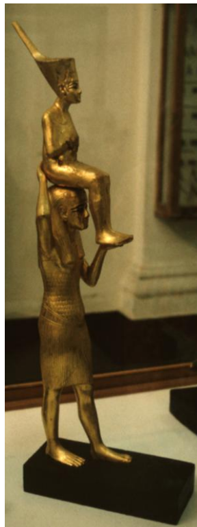
De godin Menkeret met Toetanchamon op haar hoofd.