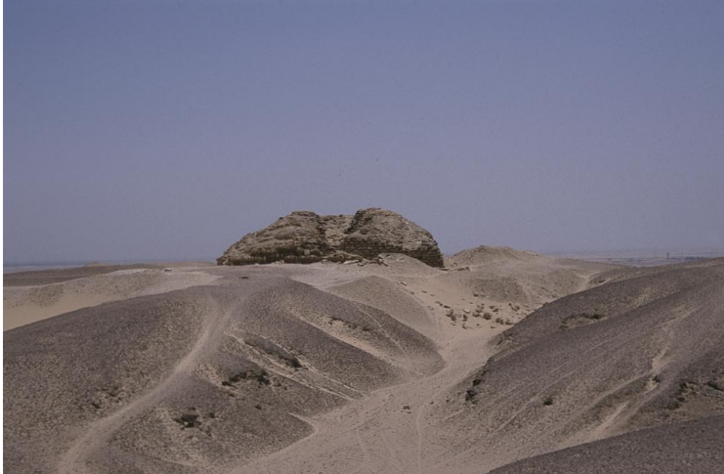
De piramide van Seila

Na de piramiden van Koela, Edfoe, Elefantine, Ombos, Sinki en Zawejet el Majetin, waaraan in Mehen Nieuws 5, 6 en 8 aandacht is besteed, rest nu nog de piramide van Seila aan de rand van de Fajoem-oase.